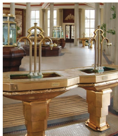
Glauber Springs Hall. Františkovy Lázně