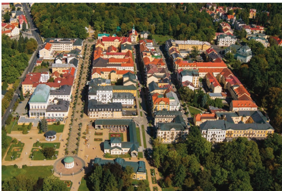
Veduta nord della “città giardino” modello di Františkovy Lázně

Nel loro periodo di massimo splendore, l’influenza esercitata dalle “Great Spas” sulle tematiche della