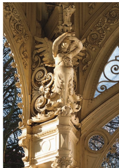
Colonnato della Sorgente del Parco (Sadový Pramen), particolare. Karlovy Vary

The Great Spas of Europe esemplifica una nuova tipologia di paesaggio storico urbano, la località termale Europea. Ciascuna delle componenti evidenzia variazioni che si inseriscono in una struttura comune caratterizzata da una zonizzazione funzionale condizionata da vincoli di natura geografica e topografica e da influenze storiche, geopolitiche e socio-economiche. Il sito presenta complessi di edifici (ivi inclusi prototipi architettonici) e spazi (in particolare spazi verdi) di straordinario valore interconnessi tra di loro a livello funzionale al fine di soddisfare le quotidiane esigenze degli ospiti.