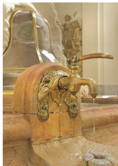
Rubinetto in ottone, particolare Source des Célestins. Vichy