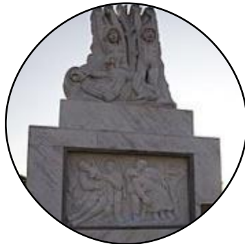
Monumento in memoria Padule di Fucecchio

L'eccidio del Padule di Fucecchio fu un crimine di guerra commesso da un reparto della 26esima Divisione corazzata tedesca, agli ordini del generale Crasemann