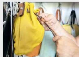
► Pattume in Prato VII

Scopri la nuova sezione del sito de Il Tirreno, dedicata esclusivamente al mondo della portualità del Medio Alto Tirreno, da Livorno a Civitavecchia, da Piombino a Carrara