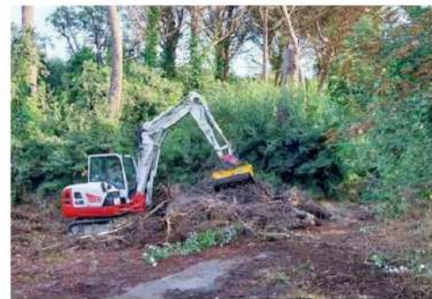
Una ruspa al lavoro nel parco dell'ex Quisisana a Montecatini Alto

Montecatini Ruspe e operai all'interno di quello che nel tempo è diventato il "bosco" dell'ex casa di cura Villa Quisisana di Montecatini