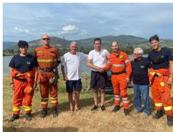
I volontari della Vab, antincendio boschivo, con la Federazione Italiana pesca sportiva per l'accordo sul nuovo osservatorio

rà attrezzato per ospitare gli operatori in vigilanza e ci sarà anche la possibilità di organizzare delle esercitazioni. Un punto strategico immerso nella bellezza della natura, che permette il controllo di una vasta area boschiva, soprattutto nel periodo estivo durante il quale, il territorio della Valdinevole caratterizzato in larga parte da un vasto polmone verde, sono sottoposti ai rischi legati agli incendi». Obiettivo del progetto è soprattutto la prevenzione e per farlo la Vab si affiderà a «Azioni di pattugliamento e di vedetta -