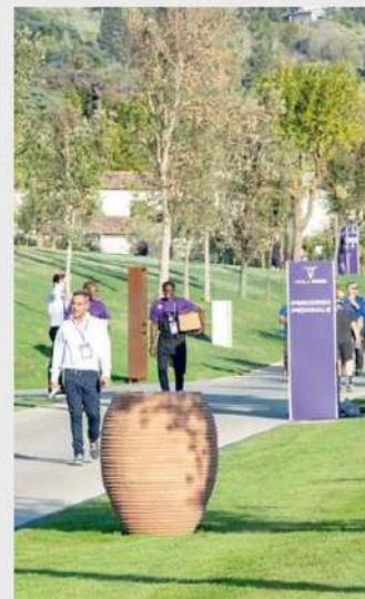
► Leoni in Firenze III

Montecatini Alto Ruspe e operai sul posto per mettere in sicurezza il parco abbandonato