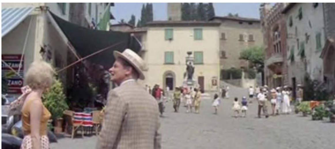
L'attore francese Alain Delon in piazza Giusti a Montecatini Alto in compagnia dell'attrice Shirly MacLaine sul set del film "Rolls Royce gialla" girato in città negli anni sessanta

C'è chi narra che non fu felice di camminare scalzo sulle pietre roventi della piazzetta