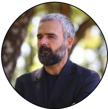
Dario Parrini Senatore

Vittime due volte. Stavolta di una «vergogna di Stato». Il senatore del Pd, Dario Parrini, scandisce bene le parole. Il volto si increspa immaginando lo strazio che provano i familiari delle vittime delle stragi nazifasciste. «Un migliaio in Italia le cause aperte per ottenere ristori. In testa Toscana ed Emilia Romagna con la loro drammatica storia – ha spiega –. Si tratta di un cammino lungo e doloroso, che non sta portando a niente». Sì, perché la ricerca della verità si trasforma per molti in un girone dantesco, infinito. E fa male, tanto. Soprattutto nel momento degli anniversari. Il prossimo, quello dell'eccidio del Padule di Fucecchio. Alla recente cerimonia per l'anniversario della strage di Sant'Anna di Stazzema, Parrini ha dunque rinnovato l'appello al Governo: «Si cambi linea, si scelga la strada della giustizia, invece che quella della negazione della giustizia con pretesti iniqui e inaccettabili».