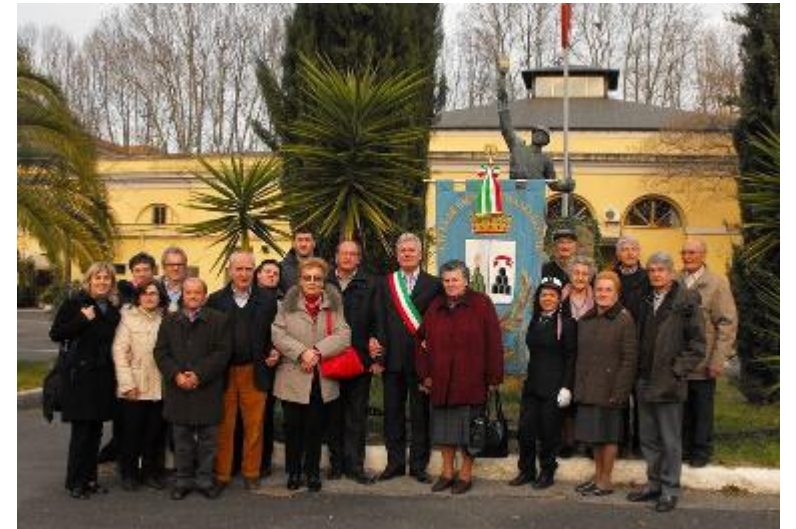
Foto di gruppo di sopravvissuti e parenti al Tribunale Militare di Roma nel 2011

Vennero sollevati tre dubbi. Qualcuno intanto criticò il fatto che a pagare dovesse essere l'Italia al posto della Germania. E poi perché dover passare ancora attraverso un tribunale per fatti ormai accertati da altre sentenze. Infine molti criticarono l'ammontare del fondo, in quanto nel nostro Paese ci sono stati ben 4.600 stragi con quasi 24mila vittime. A questi vanno poi aggiunti i deportati e le vittime dei lager. Insomma, il rischio era quello che alla fine sarebbero arrivati solo spiccioli. Per questo non tutti gli aventi diritto hanno intentato la causa. Per l'Eccidio del Padule di Fucecchio sono state una quaranti-