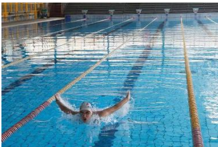
La parte invernale è stata chiusa dopo il sopralluogo effettuato dal Comune

«Il complesso della piscina comunale - affermano - in base alla relazione tecnica dello studio Lucchesi-Zambonini, necessità il ripristino della sua piena sicurezza strutturale, prioritariamente statica, ma anche sismica, mediante una serie di interventi. Dati i tempi previsti, gli esperti invitano a eseguire due lavori tampone. L'amministrazione ritiene prioritario eseguire questi interventi, visti i 230mila euro a disposizione a copertura delle spese?». Il Comune ha risposto a stretto giro di posta: «Siamo