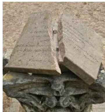
La lapide spezzata

La dolorosa eco seguita all'atto vandalico sulla lapide che commemora il giudice Antonino Caponnetto e che si trova nel giardino di Lungarno del Tempio, a Firenze, ha raggiunto anche Pistoia, città dove il giudice che nel 1984 dette vita al Pool Antimafia aveva vissuto a lungo, e dove era arrivato bambino da Caltanissetta, con la sua famiglia e dove riposa, nel cimitero della Misericordia. Si fanno interpreti di questo dispiacere la Fondazione Un Raggio di Luce e il Centro Don Lorenzo Milani. «Apprendiamo con profonda indignazione – si legge nella nota arrivata ieri in redazione – che nella notte tra sabato e domeni-