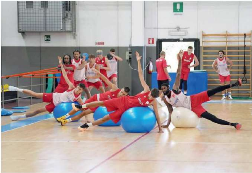
Primo giorno di allenamenti ieri al PalaMelo per Estra Pistoia