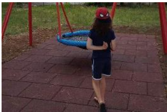
L'area pubblica di via Ancona è collocata in una parte centrale e baricentrica del territorio di Pieve a Nievole

Il verde in questione è stato oggetto negli ultimi anni di una