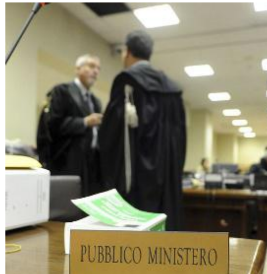
Cinque persone vennero arrestate nel maggio del 2021 per l'aggressione ai carabinieri in piazza Giuseppe Giusti