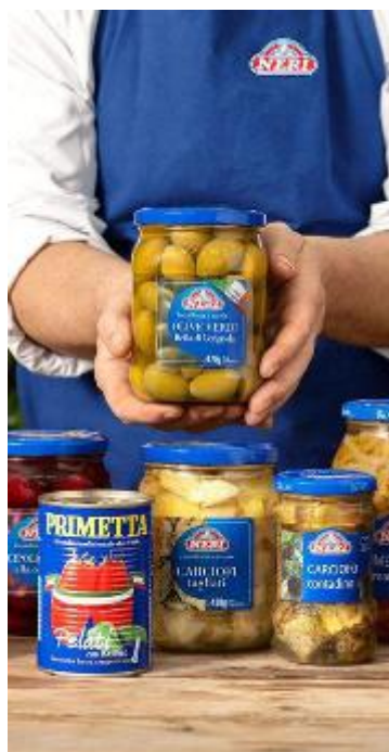
Neri Industria Alimentare Spa, fondata nel 1947, ha sede nella zona industriale di Cerbaia di Lamporecchio