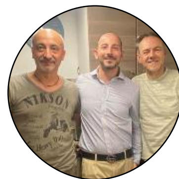
Sviluppo Valdinievole Con l'azienda orafa Gremontieri

L'associazione Sviluppo Valdinievole si affida alla storica azienda orafa fiorentina Gremontieri, con sede su Ponte Vecchio, per creare le medaglie che premiano le eccellenze del territorio.