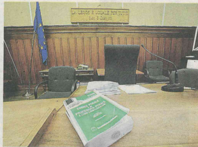
L'aula in cui ieri mattina si è svolto il processo