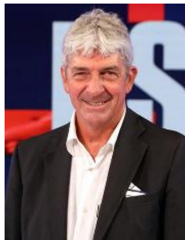
L'indimenticato Paolo Rossi, «eroe» numero uno del Mondiale 1982

Gli organizzatori hanno richiesto e ottenuto il patrocinio del Comune, tenuto conto - riporta la delibera di giunta n° 190 dell'11 luglio scorso - che l'evento si svolge con una cena nella