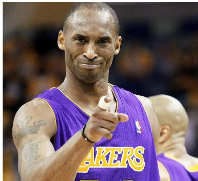
Kobe Bryant è tragicamente scomparso il 26 gennaio 2020 in California. Era nato il 23 agosto 1978 a Filadelfia