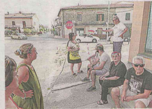
Nelle foto a sinistra il traffico in via del Gallo e alcuni abitanti che protestano per il passaggio di tanti mezzi pesanti