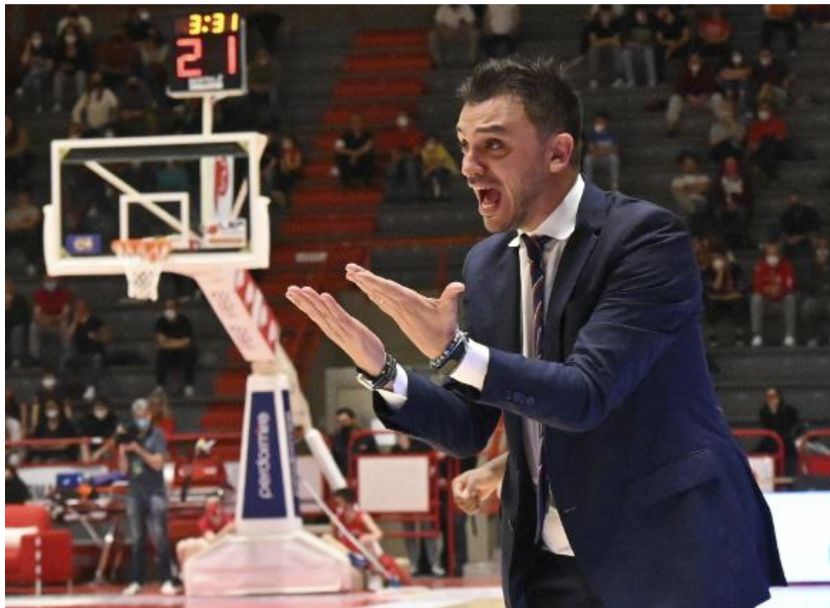
Coach Brienza non si fa impressionare dal girone rosso nel quale è stata inserita Pistoia

«Sulla carta verrebbe da dire che le squadre che hanno speso di più sono tutte nell'altro girone, ma osservando bene anche nel rosso ci sono club come Udine, Forlì, Cento e la Fortitudo