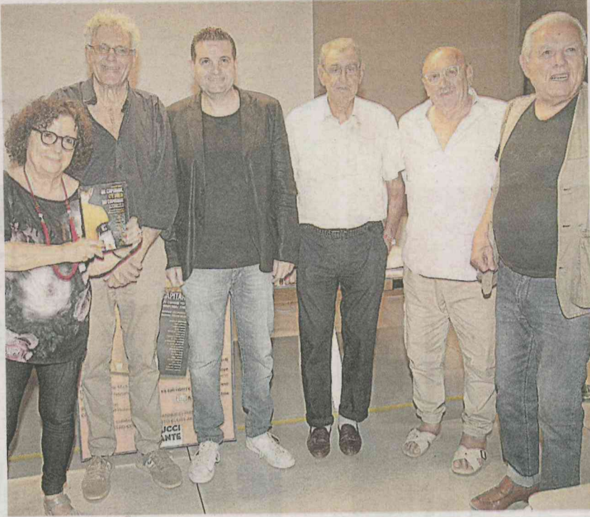
Foto di gruppo a fine presentazione del libro