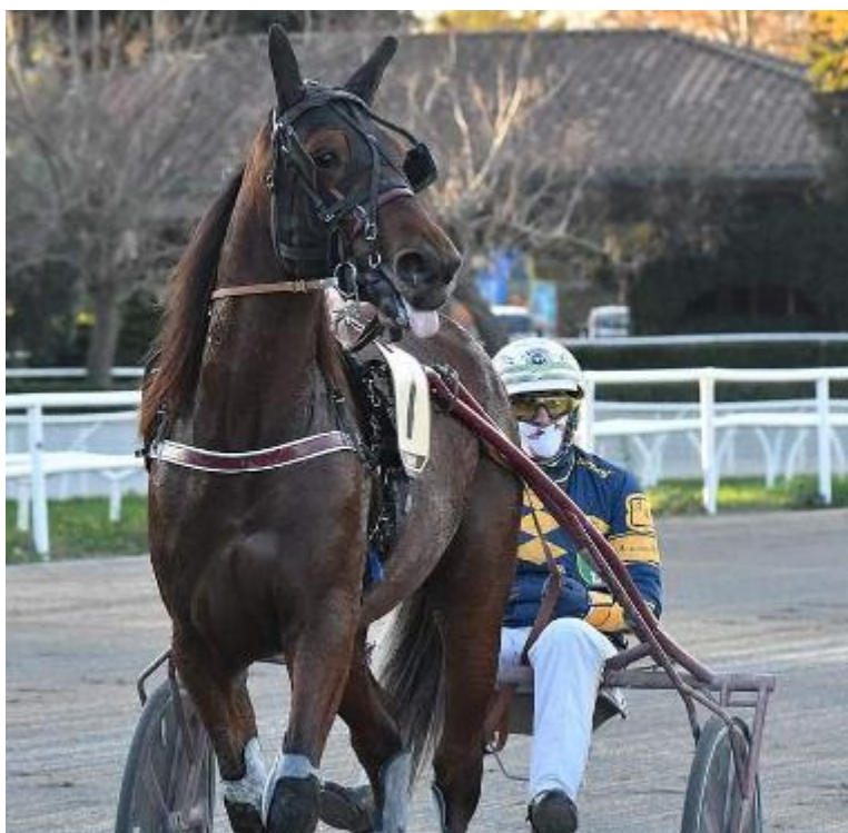
Dragowski autore del record europeo dei tre anni con 1.10.9

Il Sesana riparte dal 70° gran premio Società Terme Memorial Vivaldo Baldi. La corsa dedicata ai cavalli di tre anni sulla lunga distanza è stata posticipata a domani sera per lavori di manutenzione straordinaria alla pista. Il primo grande evento della stagione torna nel suo format originale ovvero maschi e femmine a confronto in un'unica prova con un montepremi complessivo di oltre quaranta mila euro. Nei giorni scorsi l'ufficio tecnico del Sesana ha provveduto ad effettuare il classico sorteggio dei numeri di partenza dei dieci cavalli al via: ricordiamo che la procedura dei partenti per i gran premi segue una precisa procedura imposta dal Mipaaf ovvero iscrizioni, classifi-