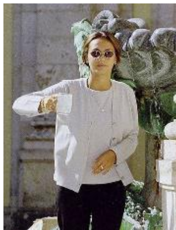
Terme di Montecatini nell'Unesco. Quanti lo sanno fuori città?

L'amministrazione comunale ha manifestato la volontà di valorizzare l'ingresso delle terme nel patrimonio Unesco, incentivando la realizzazione di iniziative di richiamo anche turistico. «A tale fine - riporta la determina 529 dell'8 luglio - celebreremo il primo anniversario della iscrizione nella World Heritage List avvenuto il 31 luglio 2021 con il coinvolgimento di autorità, istituzioni e cittadinanza. Montecatini Terme for Unesco si