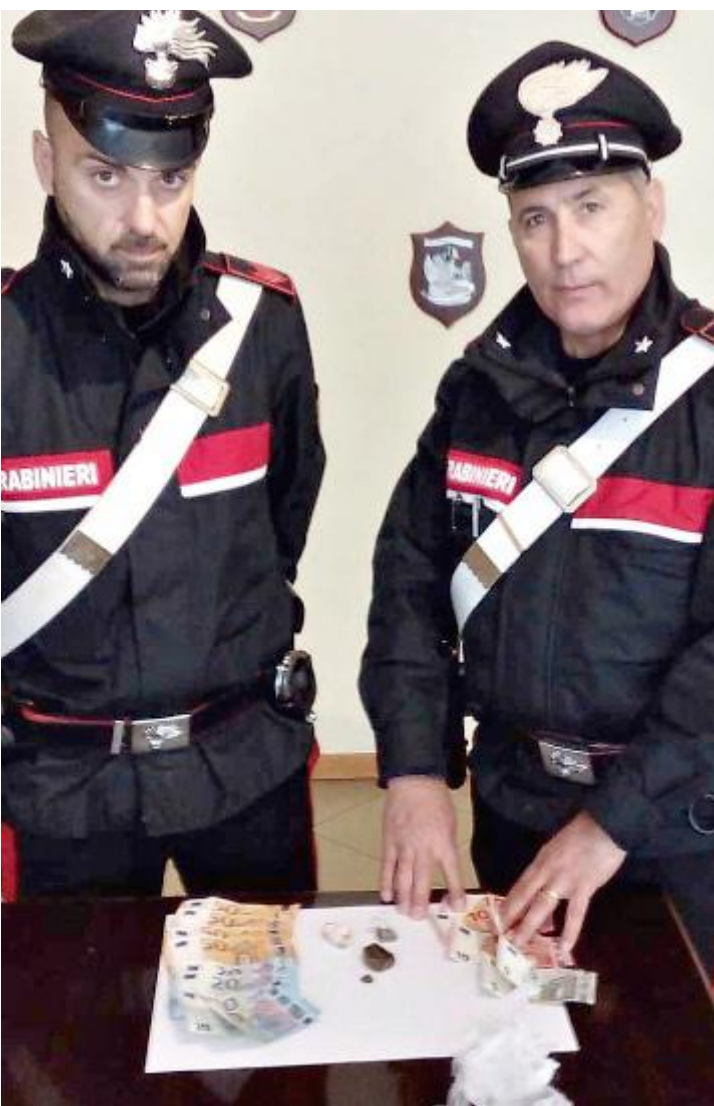
Lo spacciatore finito ai domiciliari aveva 400 euro in contanti e alcune dosi di stupefacente pronto per essere venduto