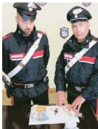
La droga sequestrata

Il trentenne è stato fermato da una pattuglia dei carabinieri nella serata di sabato mentre si aggirava dalle parti di piazza Celli, dietro alla centralissima basilica di Santa Maria Assunta. Alla vista dei militari ha iniziato ad agitarsi, temendo che lo volessero