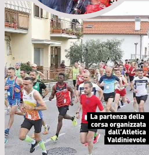
La partenza della corsa organizzata dall'Atletica Valdinievole

PESCIA EVENTO IL 12 MAGGIO APERTO A TUTTI. PERCORSI DA 20 A 4 CHILOMETRI