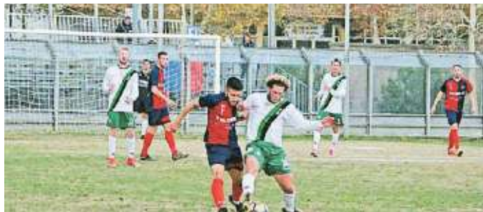
Un'azione di Zoncu (Pro Livorno, a destra)