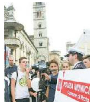
Un'iniziativa della Polizia municipale per le scuole dedicata all'educazione stradale (archivio)

PRATO. Si terrà sabato 4 maggio dalle 17 in poi all'Omnia Center di via delle Pleiadi "I volti della sicurezza", organizzato dalla Polizia municipale in collaborazione con Aci e Omnia Center. L'unità operativa educazione stradale allestirà un percorso per i piccoli con il monopattino nel rispetto della segnaletica stradale; ci sarà inoltre un gazebo informativo sulle attività che la Polizia municipale svolge nelle scuole. —