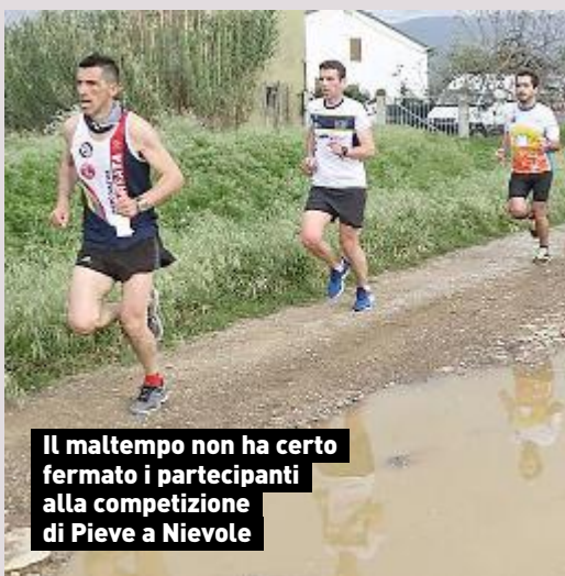
Il maltempo non ha certo fermato i partecipanti alla competizione di Pieve a Nievole

discese mediamente impegnative tra scorci di campagna che lasciano senza fiato. La modalità di partecipazione potrà essere competitiva, per atleti che presenteranno regolare certificato medico per attività agonistica, e non competitiva per tutti gli altri. Per i bambini più piccoli è prevista invece una camminata di 4 km lungo la Via della Fiaba, dove si potranno incontrare i personaggi di Pinocchio in carne e ossa dalla fata Turchina al Gatto e la Volpe. Per i primi 200 ci sarà in premio una medaglia.