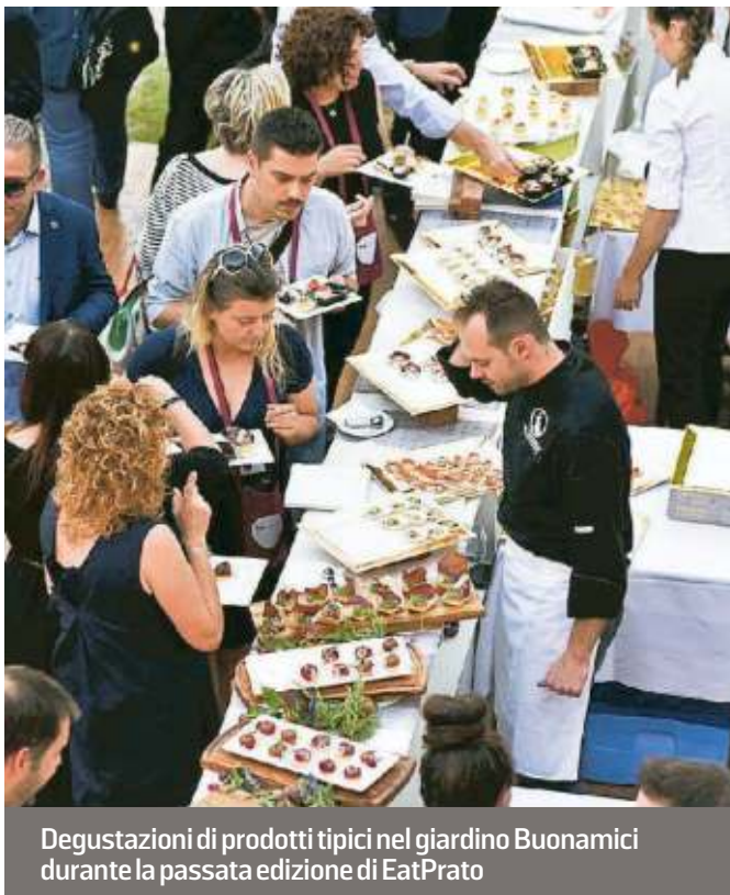
Degustazioni di prodotti tipici nel giardino Buonamici durante la passata edizione di EatPrato

"Genio e Follia, oltre la tradizione". Questo il claim che accompagnerà la quarta edizione di eatPrato: il prodot-