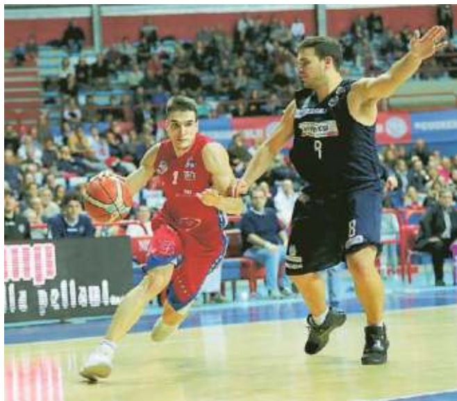
Bolis tenta una percussione

care un primo tempo splendido. I suoi 8 punti nel primo quarto impediscono la fuga di Siena, e i suoi 8 punti nel secondo evitano che grauno prenda subito una piega amara.