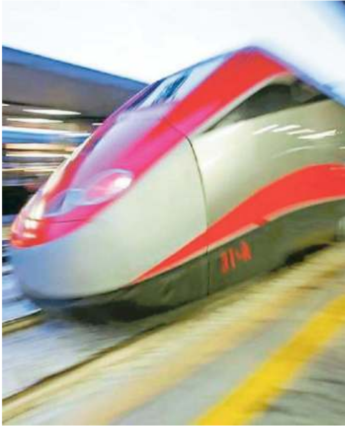
Il Frecciarossa sarebbe dovuto partire alle 5,17

È successo all'alba di ieri alla stazione di Brescia. Il Frecciarossa etilico era il 9604 delle 5.17 da Brescia per Napoli. Che ci fosse qualcosa di insolito l'hanno capito per primi i passeggeri, rimasti sulla banchina perché nessuno sbloccava le porte delle carrozze. Poi è andato a indagare il capotreno che ha scoperto che nell'avveniristica cabina di pilotaggio del supertreno ad alta velocità c'era un macchinista solo invece che due e che l'unico presen-