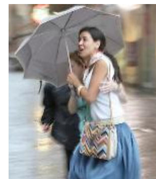
Il nubifragio di ieri ha colto molti di sorpresa

Il trentenne controllato dai carabinieri è stato trovato in possesso di 16 grammi di hashish già suddivisi in dosi pronte per lo spaccio, 1,6 grammi di marijuana e circa quattrocento euro in contanti. Perquisita anche la sua abitazione dove è stato rinvenuto altro materiale per il confezionamento della droga. E' stato tutto posto sotto sequestro.