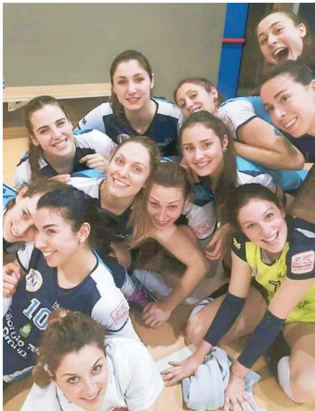
L'esultanza delle ragazze del Blu Volley Quarrata a fine partita