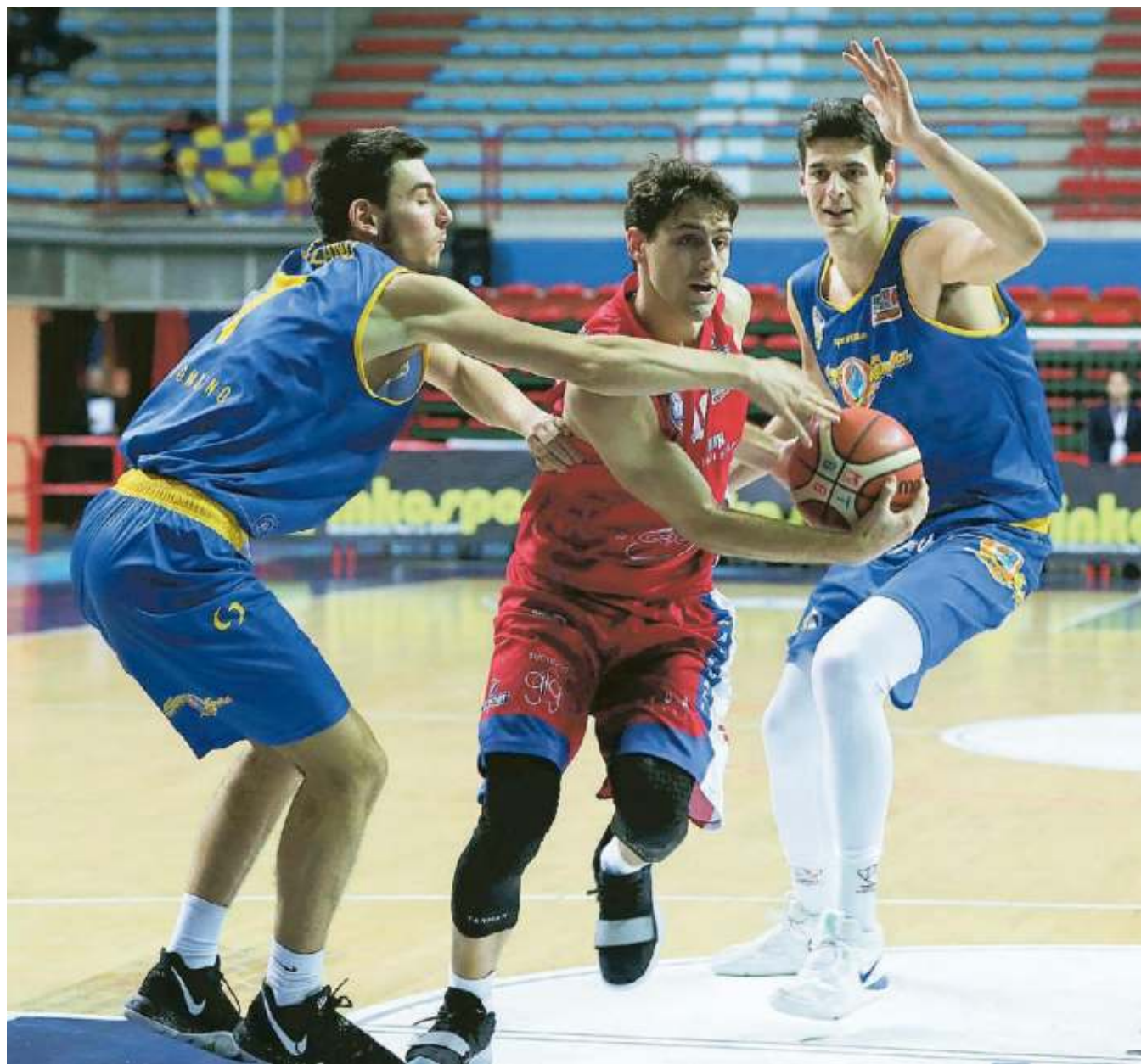
Galli, ancora una volta il migliore in casa Montecatini