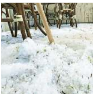
Montecatini, grandine fra i tavoli

PISTOIA. Revival d'autunno, malgrado sia primavera inoltrata. Per una perturbazione atlantica, che colpisce soprattutto il Nord Est e le regioni centrali, è tornato il freddo, con temperature inferiori ai valori medi del periodo e grandine, pioggia e neve fin sotto i mille metri. In Toscana le temperature sono crollate, finendo sotto lo zero termico sull'Appennino (Foce del Gio-