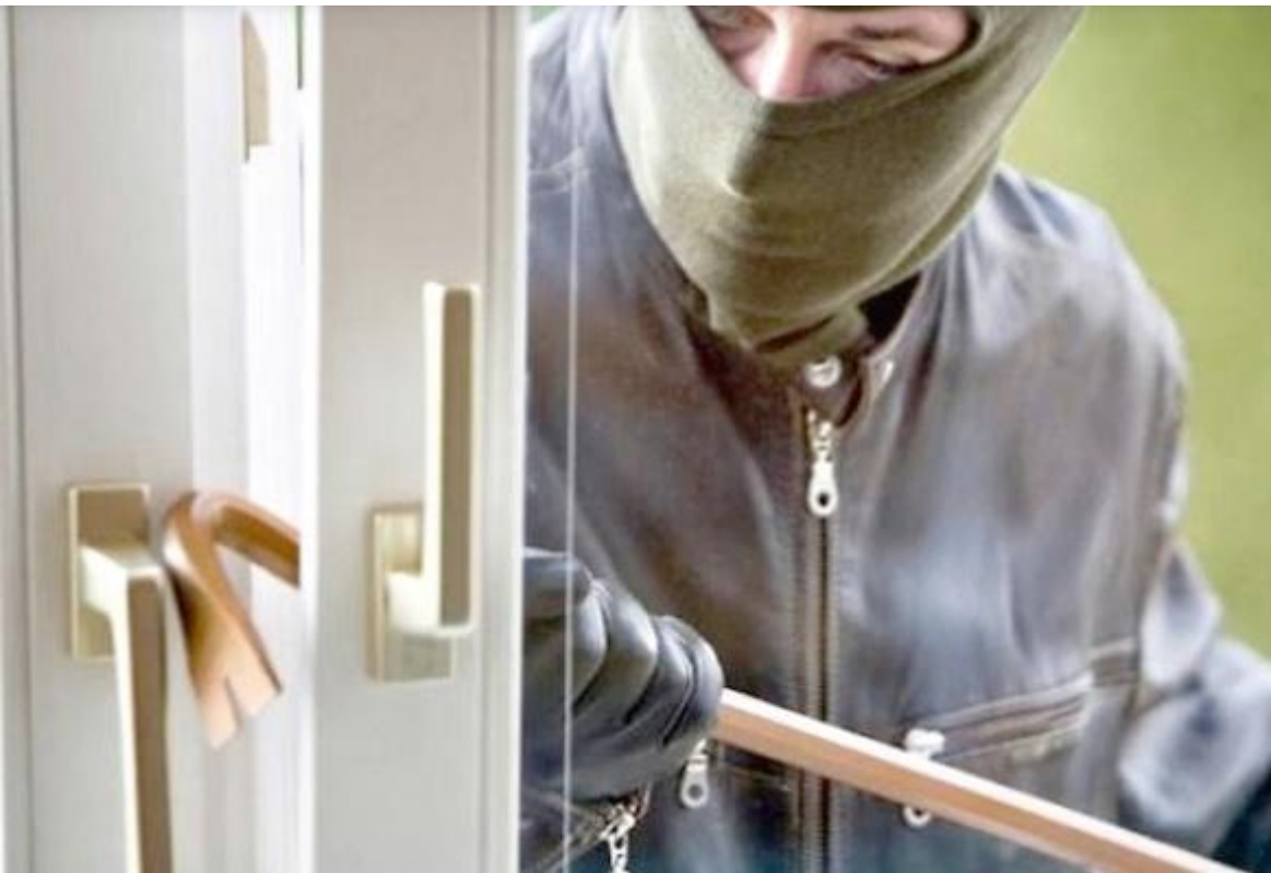
Il maxifurto in appartamento è avvenuto sabato sera nel centralissimo corso Matteotti di Montecatini