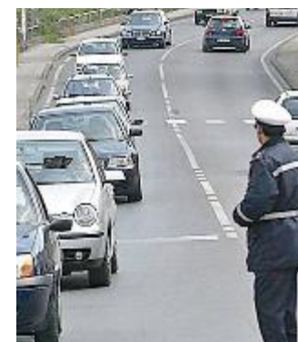
Code e caos a Pieve a Nievole